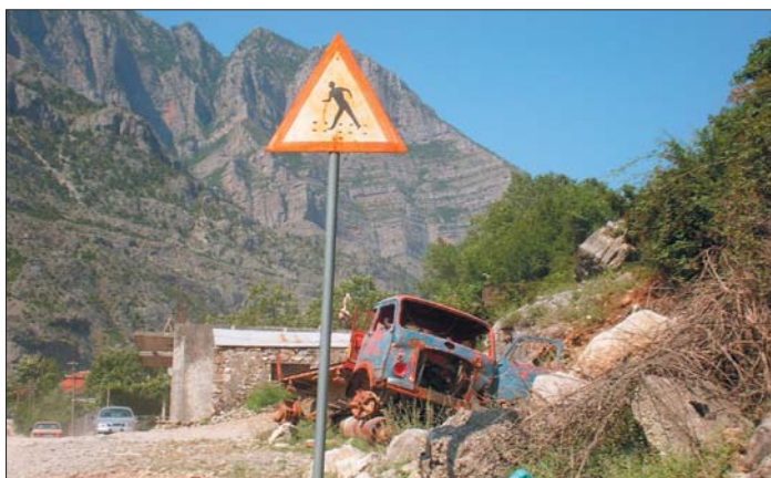
Přechod pro chodce v horské vesničce Tamarë na trase Vermosh – Škodra

Druhou populární trasu naleznete na cestě, spojující černohorsko-albánskou hranici, z příhraniční vesnice Vermosh do města Škodry na březích Skaderského jezera. Prašná a kamenitá cesta, vlnící se po úpatích vysokých skalních masivů, klesá k dravým řekám, přejíždí je po dřevěných mostech, aby mohla rázem vystoupat o tisíce výškových metrů a nabídnout vám úchvatný pohled na celé údolí pod vámi a na vzdálené moře na opačné straně. Po cestě projedete několika vesnicemi,